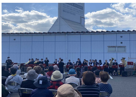
田原市民センター開館20周年記念式典における 記念演奏会（吹奏楽部）