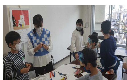
朽網市民センターで小学生科学実験 (ボランティア部)