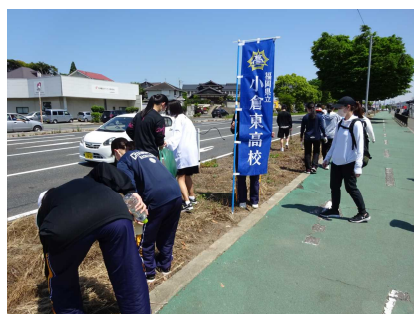
PTAとともに地域清掃ボランティア活動

東高は地域からの強い要望によってできた学校です。これからも、学校周辺地域の活動に積極的に参加し、地域に根ざした学校を目指すとともに、地域の課題解決を図る有能な人材を育成、輩出していきます。